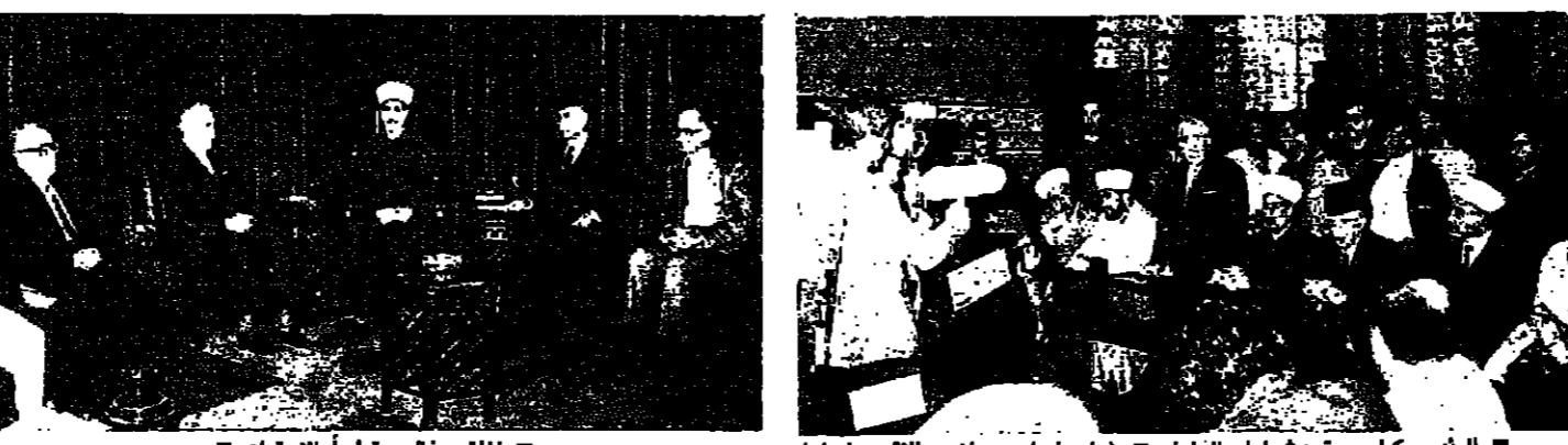
الرئيس كرامي يتحدث امام العلماء (اسماعيل حداد والاتي ونهرا)

اعبر بيان الاجتماع الذي عقد في دار الفتوى ان ابناء بيروت لن يكونوا عاجزين عن الوقوف بوجه الممارسات الشاذة. مؤكدا ان ما جرى في بيروت الغربية من شذات عارضة مسيرة الانتفاضة، مستكرا كل التصرفات التي حصلت اذعيا في تطويقها، ومطالبها بالالتزام بمسؤولياتهم الوطنية للانتفاضة حول ما يجرى وحدة بيروت.